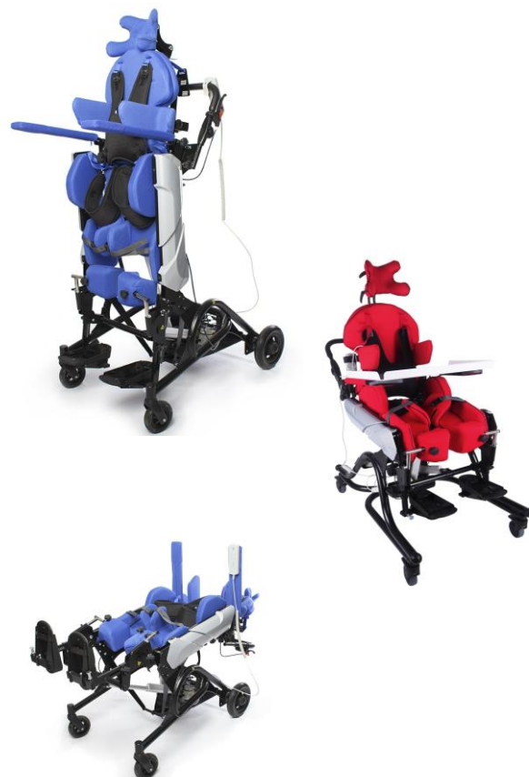
Abb. Enthält Zubehör